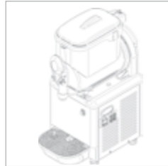
G5 Super 1