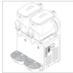
G5 Super 2