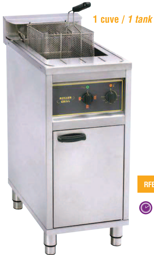
RFE 16 C 25 kg French fries/h