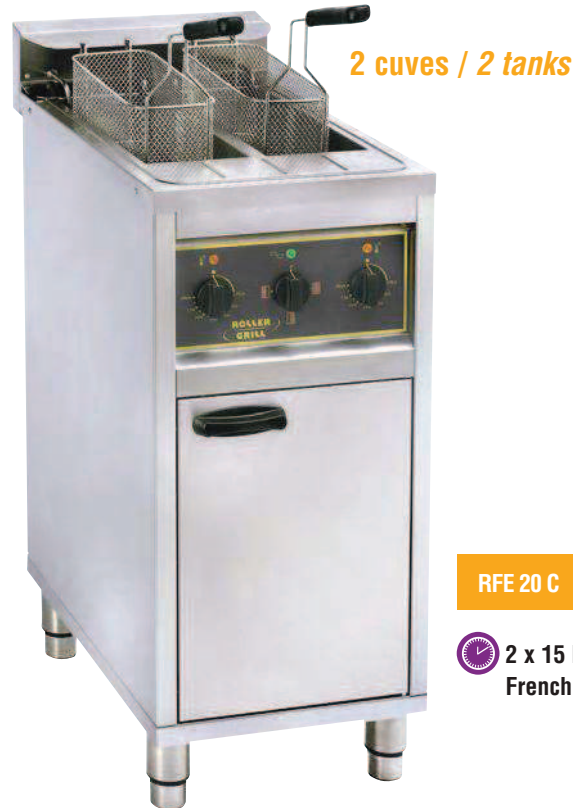
RFE 20 C 2 x 15 kg French fries/h