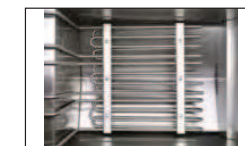
Résistance, brides et cache-filtrant / Heating element, flanges and filtering cover