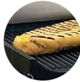
Double-Panini R - Standard