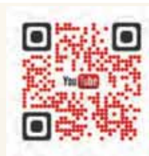
Video CFE 400

1 kg mix + 1,8 L d'eau (water) = 20 crêpes