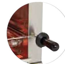
Poignée thermorésistante / Heating resistant handle