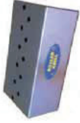
Présentoir / Display P08002Z03