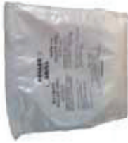
10 kg mix = 330 gaufres / waffles