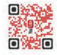
Video GES 23