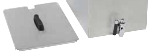
FD 80 DR