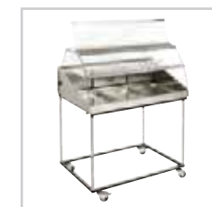
VHC 1000 + TS 3