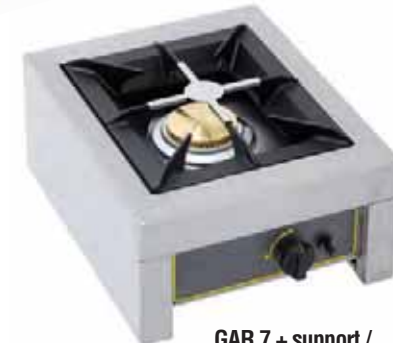
GAR 7 + support / holder