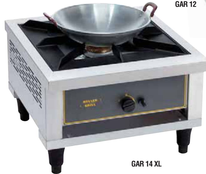
GAR 14 XL